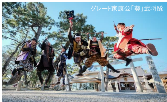
グレート家康公「葵」武将隊

◆お申込締切 2018年2月23日(金) *お申込締切日前であっても、ご参加申込が募集定員に達した場合は、お取消待ちとして受け付けます。