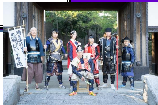
忍城おもてなし甲冑隊